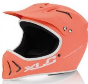
Casques intégral monocoque.