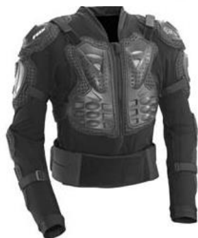
Gilets intégral de protection