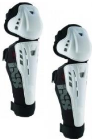
Protections genoux tibias.