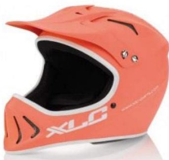
Casques intégral monocoque.