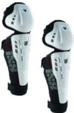
Protections genoux tibias.