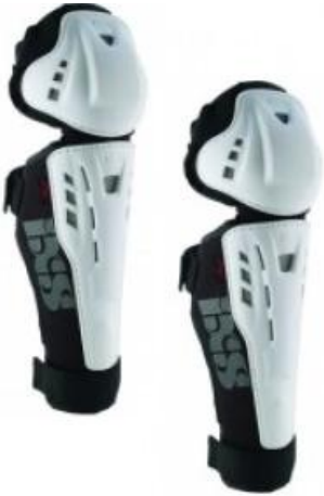
Protections genoux tibias.