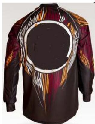
Pantalons long DH ou Jeans et maillot longs (short de DH toléré).