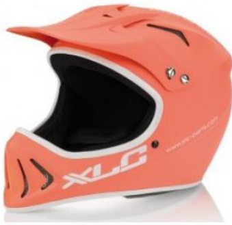
Casques intégral monocoque.