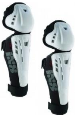
Protections genoux tibias.